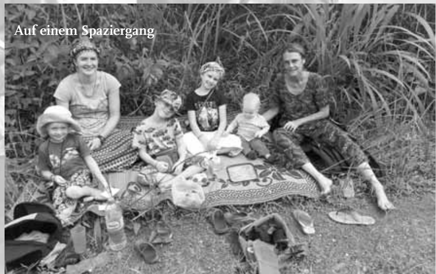
Auf einem Spaziergang