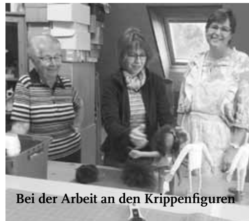
Bei der Arbeit an den Krippenfiguren