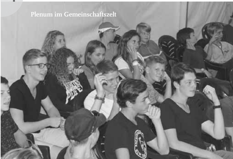
Plenum im Gemeinschaftszelt