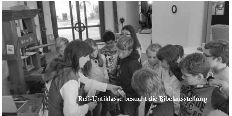
Reli-Untiklasse besucht die Bibelausstellung