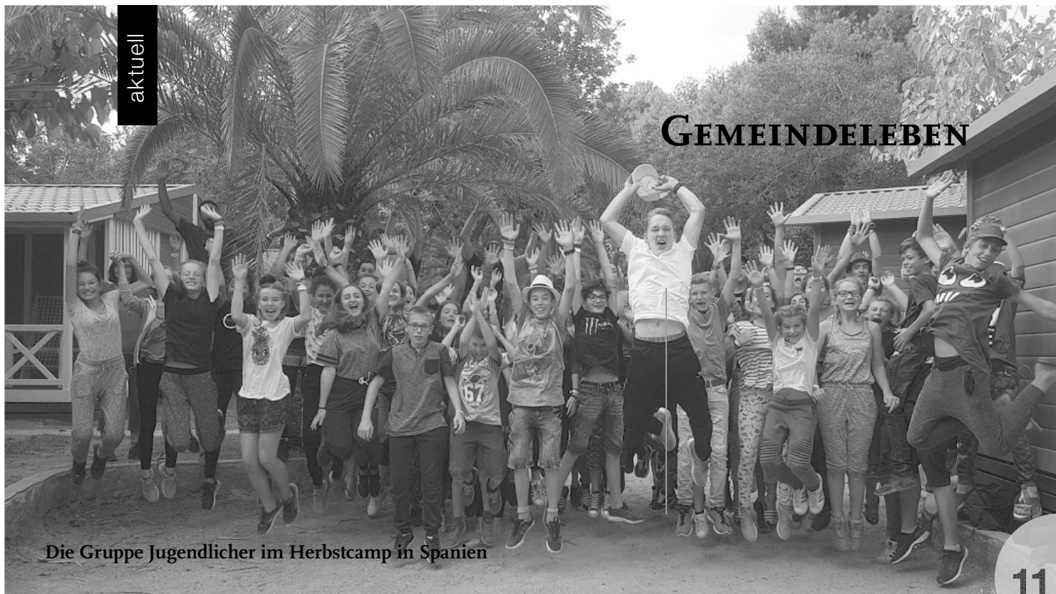
Die Gruppe Jugendlicher im Herbstcamp in Spanien