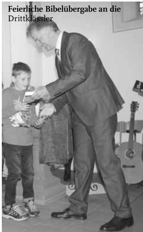
Feierliche Bibelübergabe an die Drittklässler