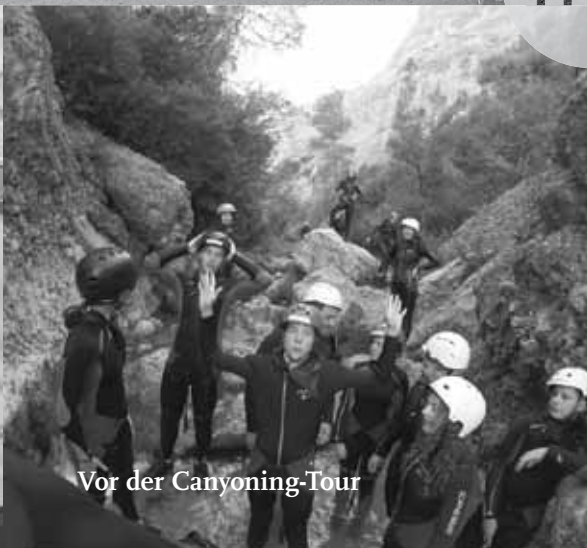
Vor der Canyoning-Tour