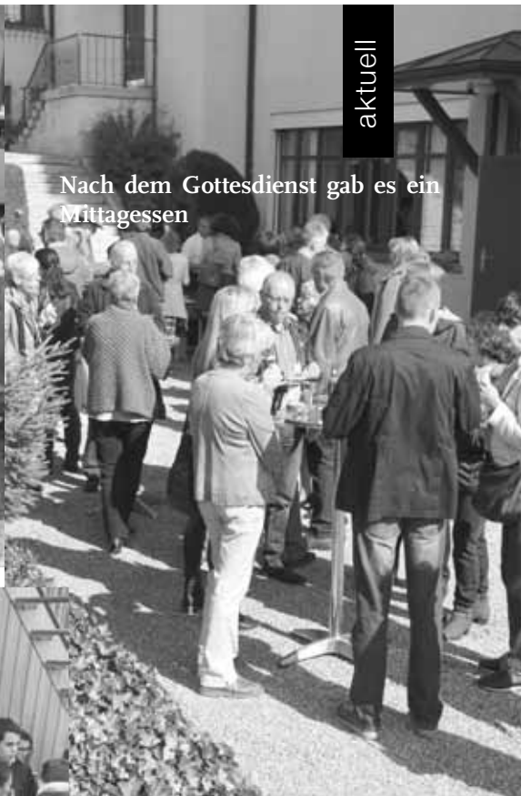
Nach dem Gottesdienst gab es ein Mittagessen