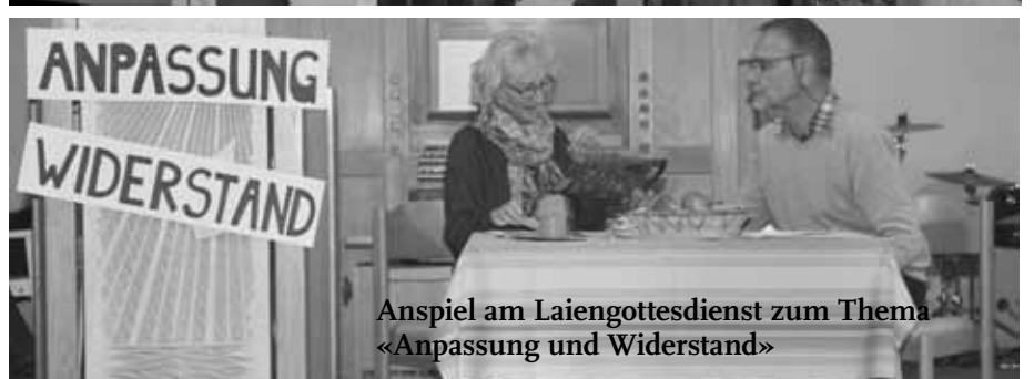
Anspiel am Laiengottesdienst zum Thema «Anpassung und Widerstand»