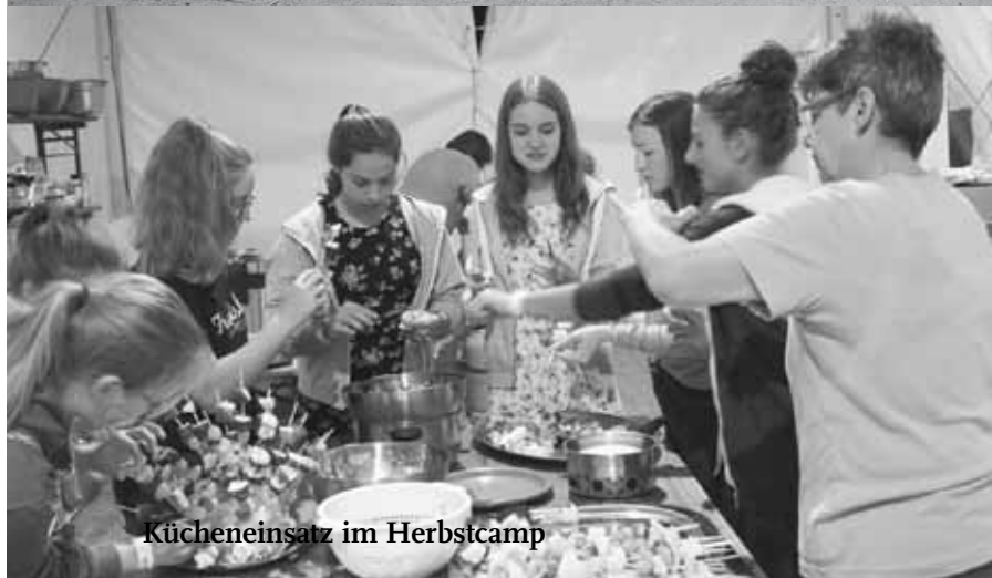
Kücheneinsatz im Herbstcamp