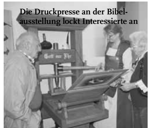
Die Druckpresse an der Bibelausstellung lockt Interessierte an