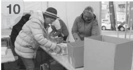
Helferinnen bei der Päckliaktion