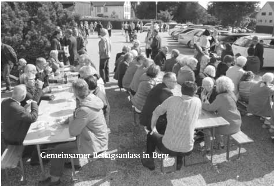
Gemeinsamer Bettagsanlass in Berg