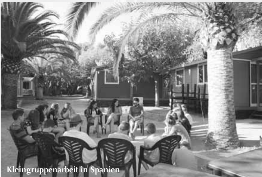
Kleingruppenarbeit in Spanien

zu 70% durch den Förderverein finanziert. Darüber hinaus ermöglicht Juwel eine grosse Lagerarbeit und fördert Jugendliche im Blick auf kirchliche Berufe. Herzlichen Dank für all Ihre Gaben.