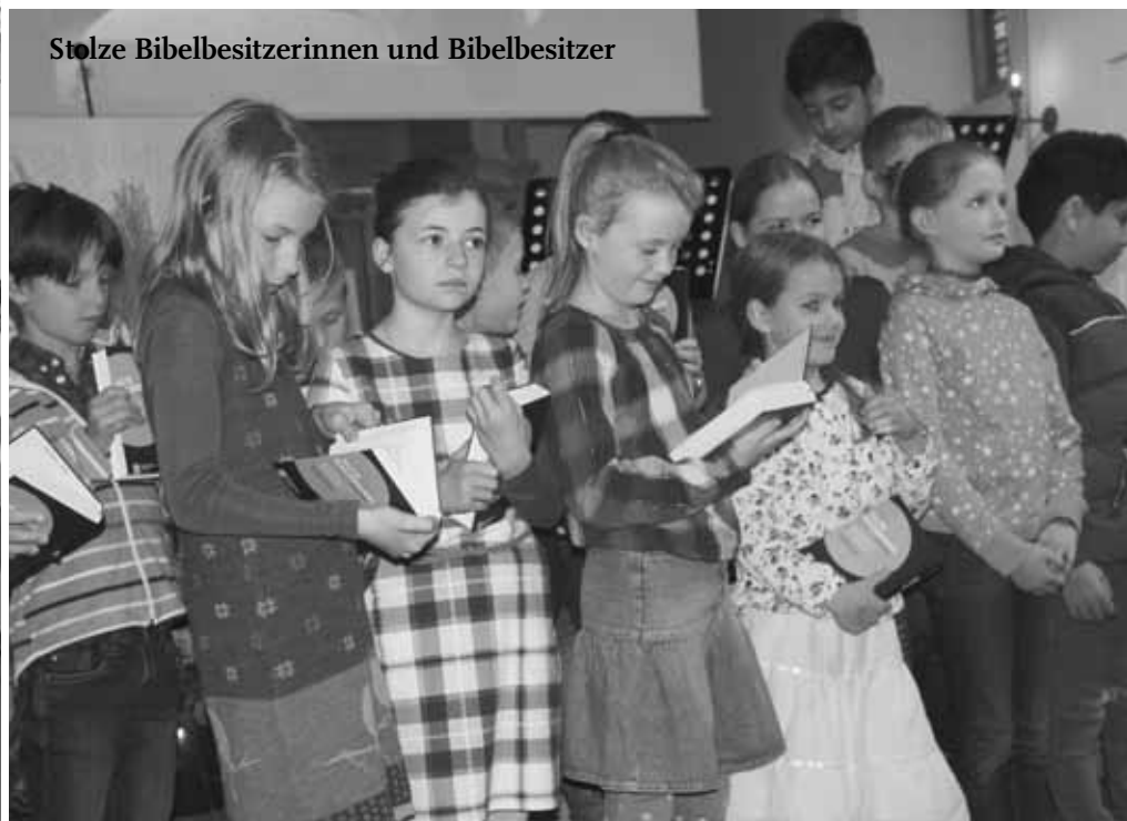
Stolze Bibelbesitzerinnen und Bibelbesitzer