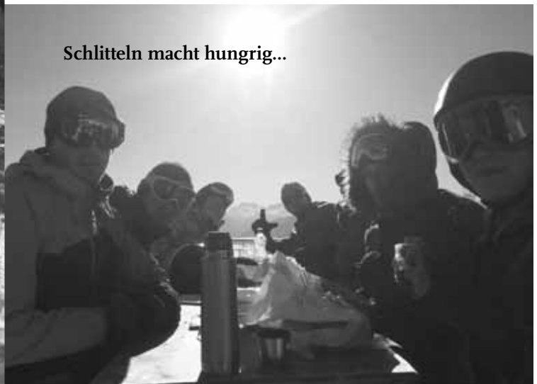
Schlitteln macht hungrig...