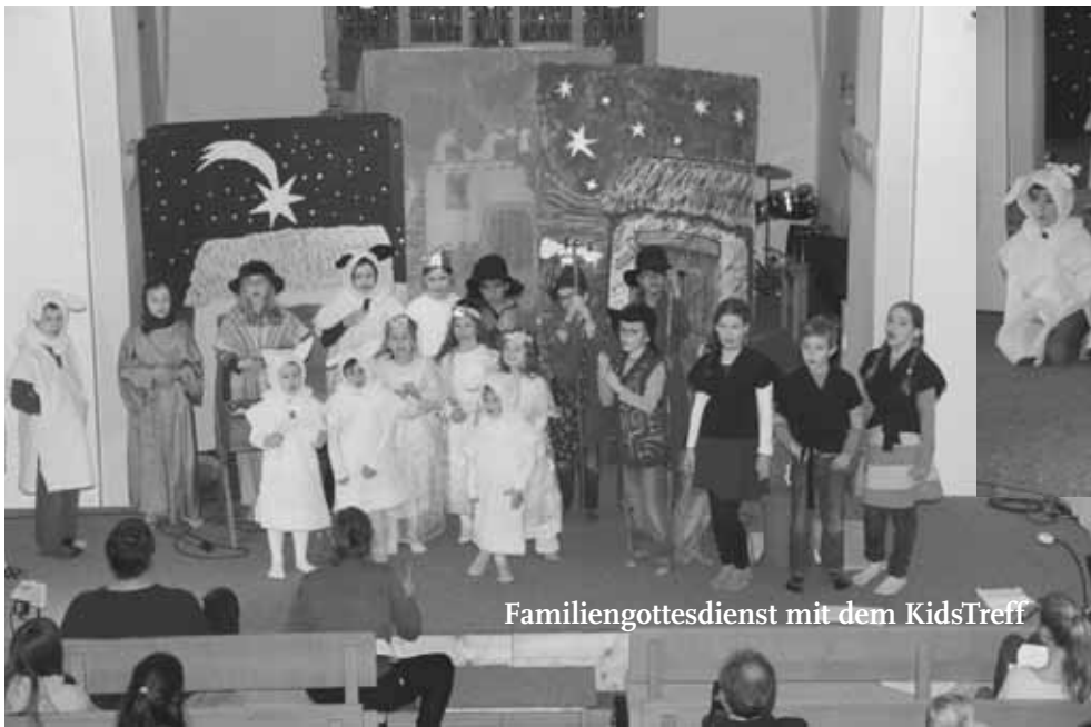
Familiengottesdienst mit dem KidsTreff