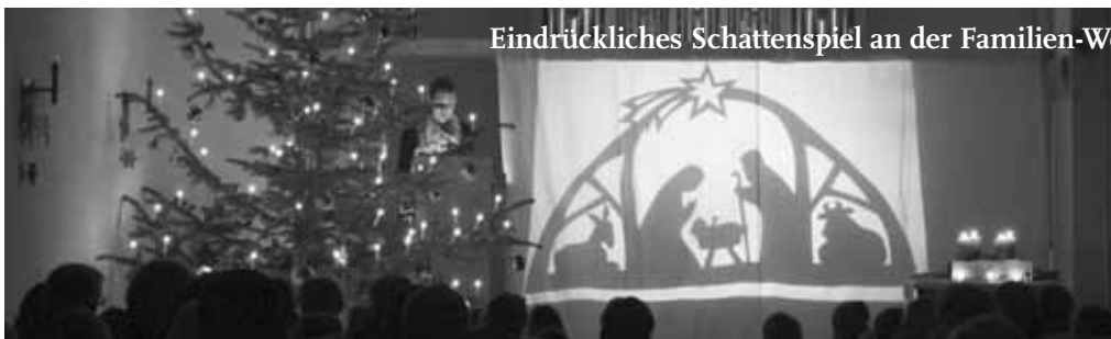
Eindrückliches Schattenspiel an der Familien-Weihnachtsfeier