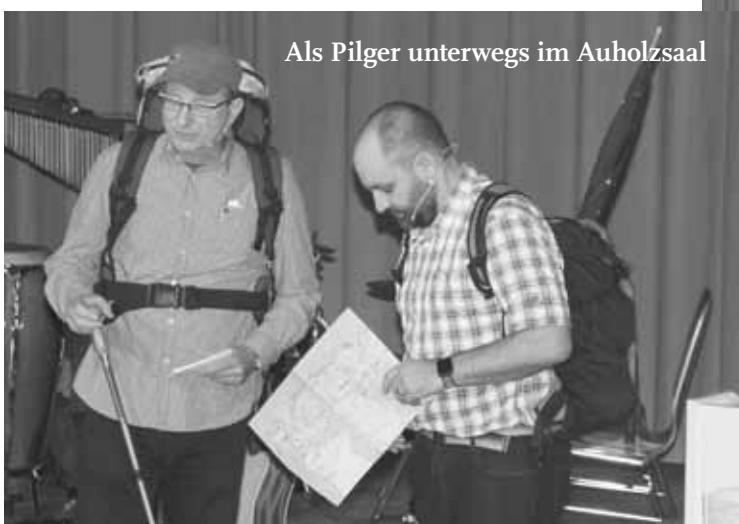
Als Pilger unterwegs im Auholzsaal