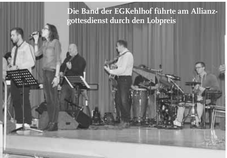
Die Band der EGKehlhof führte am Allianz-gottesdienst durch den Lobpreis