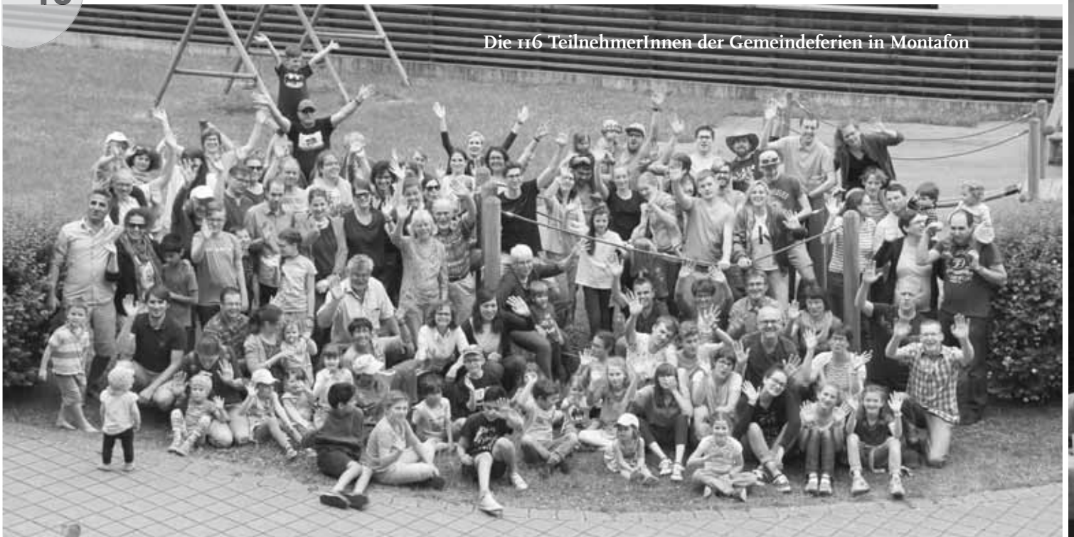
Die 116 TeilnehmerInnen der Gemeindeferien in Montafon