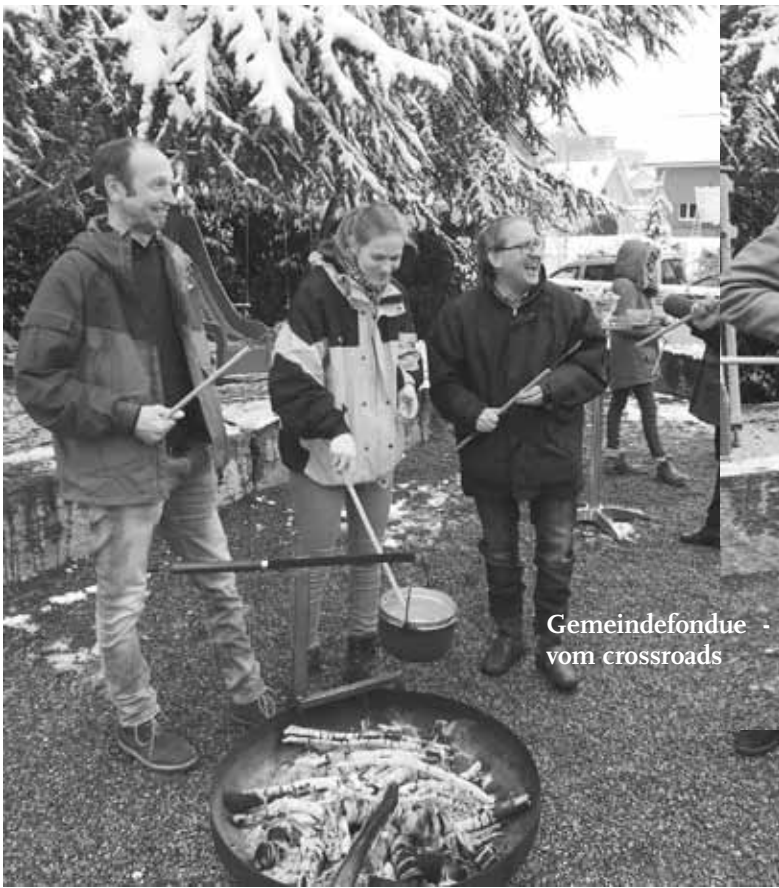
Gemeindefondue - offeriert vom crossroads