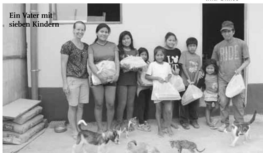
Ein Vater mit sieben Kindern

Das Geld stammte dieses Mal vom Frauenverein des Schweizer-Clubs in Lima. Es hat sich mittlerweile an der Schule unserer Kinder und auch im Club herumgesprochen, dass wir dafür sorgen, dass Spenden bei den Not leidenden Menschen auch wirklich ankommen. Gern übernehmen wir die