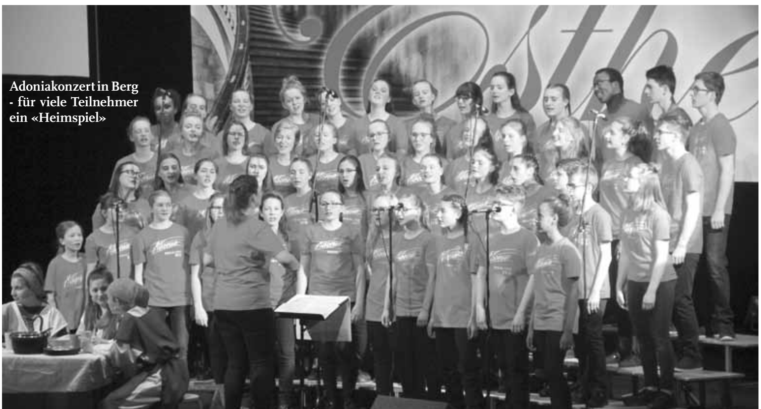
Adoniamkonzert in Berg - für viele Teilnehmer ein «Heimspiel»