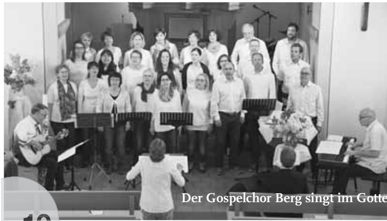
Der Gospelchor Berg singt im Gottesdienst