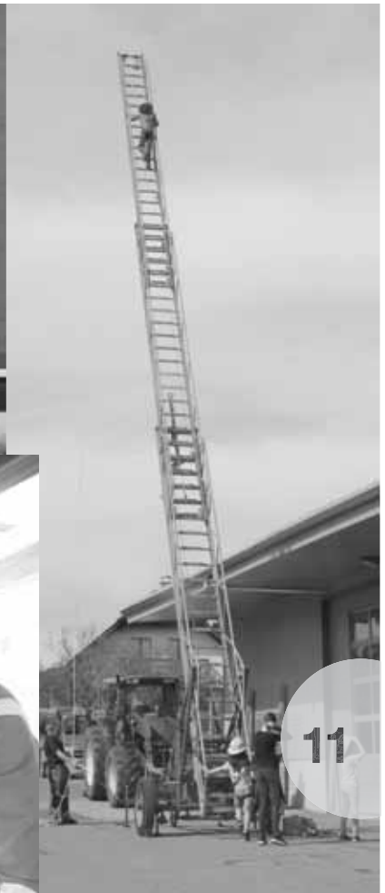
Impressionen von der Kinderwoche 2018