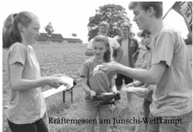
Kräftemessen am Jungschi-Wettkampf

Zusammen mit anderen Jungscharen und TCs der Region verbrachten unsere Kids und Teens drei unvergessliche Tage in Illighausen. Gemeinsame Lobpreiszeiten im grossen Gemeinschaftszelt und tiefgründige Inputs standen auf dem Programm. Selbstverständlich durfte auch der Legendäre Jungschi-Wettkampf am Sonntag nicht fehlen.