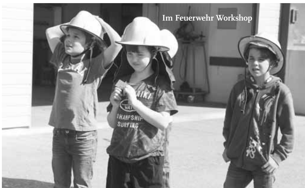
Im Feuerwehr Workshop

Wir danken Gott für die gute Stimmung, die ausgesäten Samen in die Herzen der Kinder und Eltern, die Bewahrung, die wir erleben durften und das gute Wetter, das vieles vereinfachte und ermöglichte.