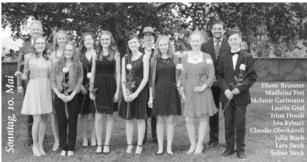
Sonntag, 10. Mai