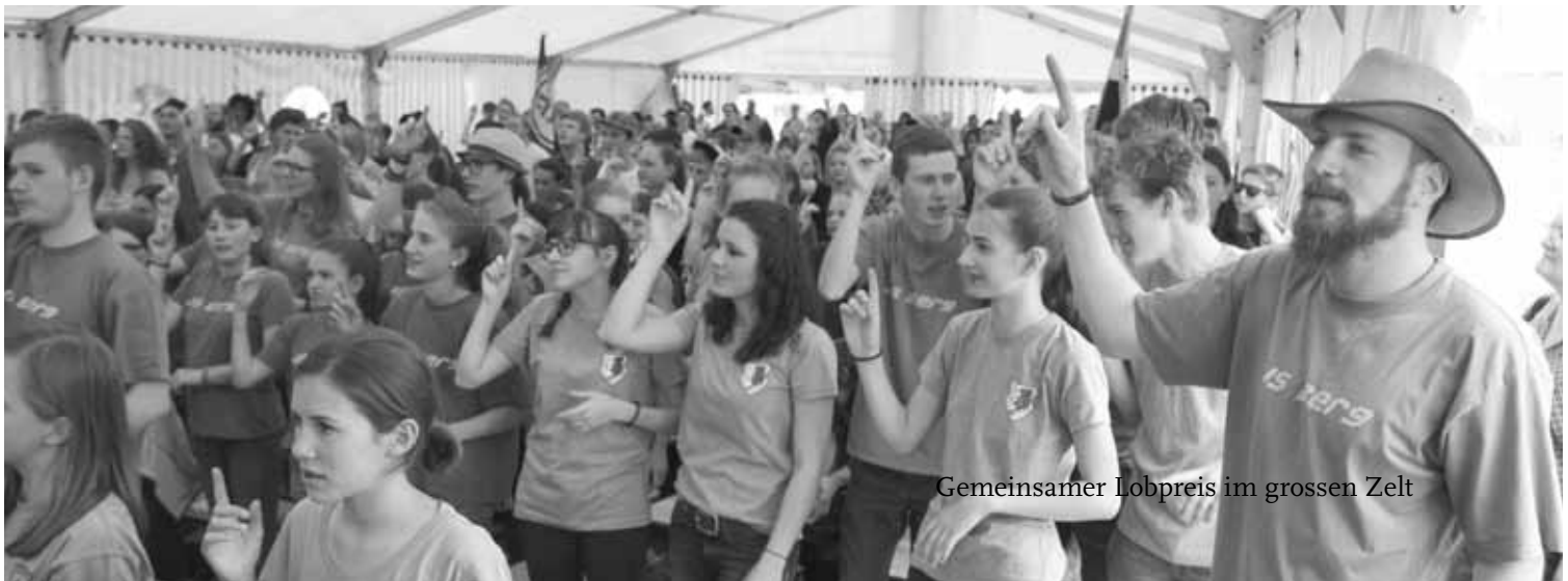
Gemeinsamer Lobpreis im grossen Zelt