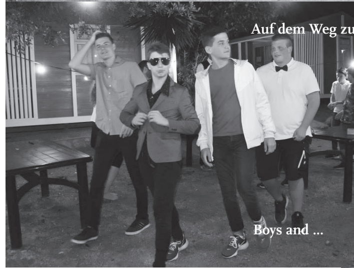
Auf dem Weg zum Casionoabend