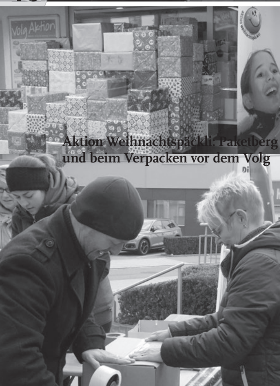
Aktion Weihnachtspäckli: Paketberg und beim Verpacken vor dem Volg