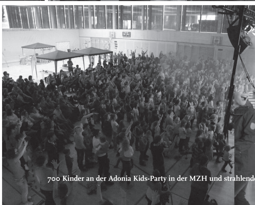
700 Kinder an der Adonia Kids-Party in der MZH und strahlende