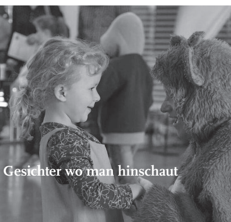
Gesichter wo man hinschaut