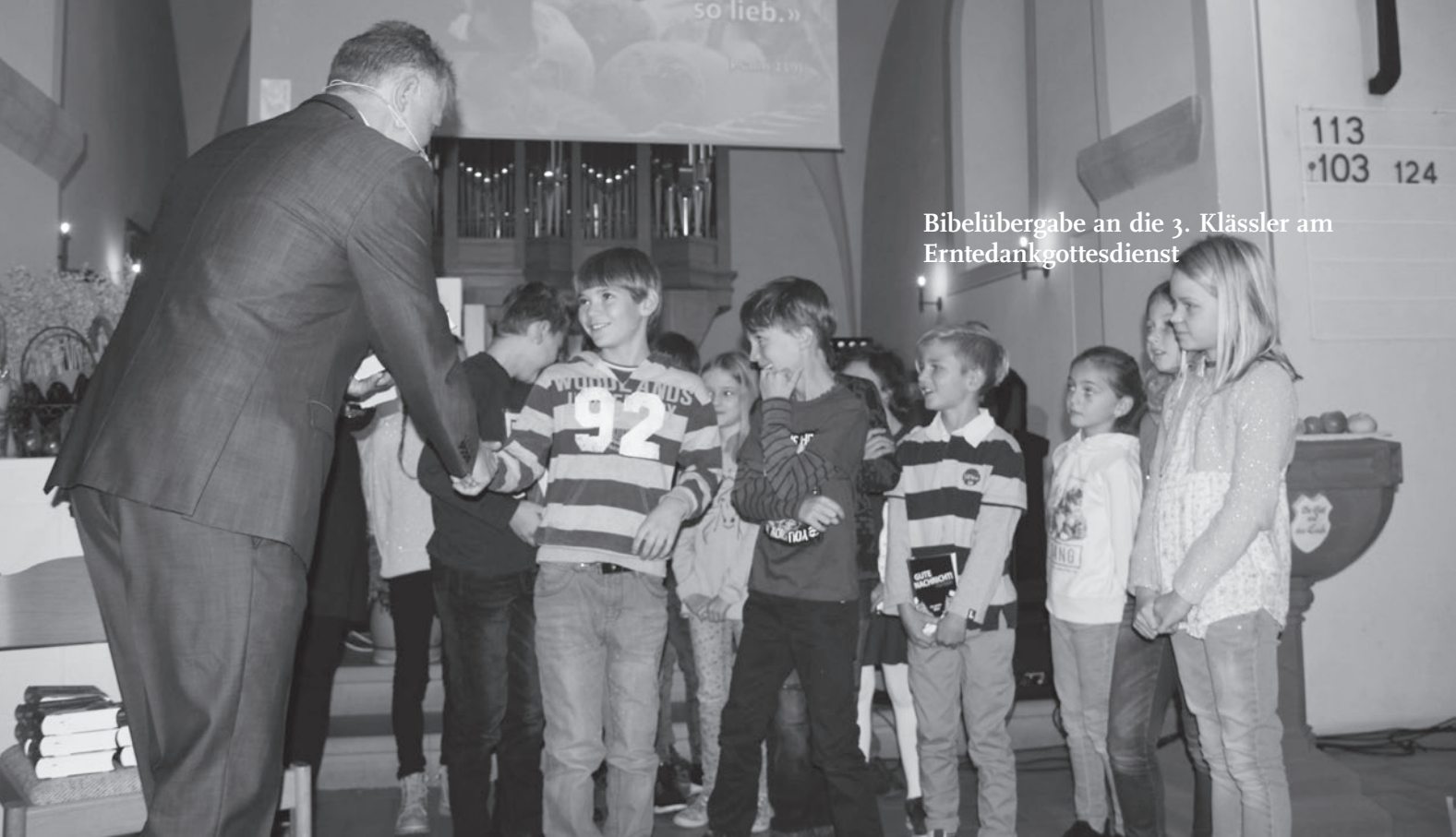
Bibelübergabe an die 3. Klässler am Erntedankgottesdienst