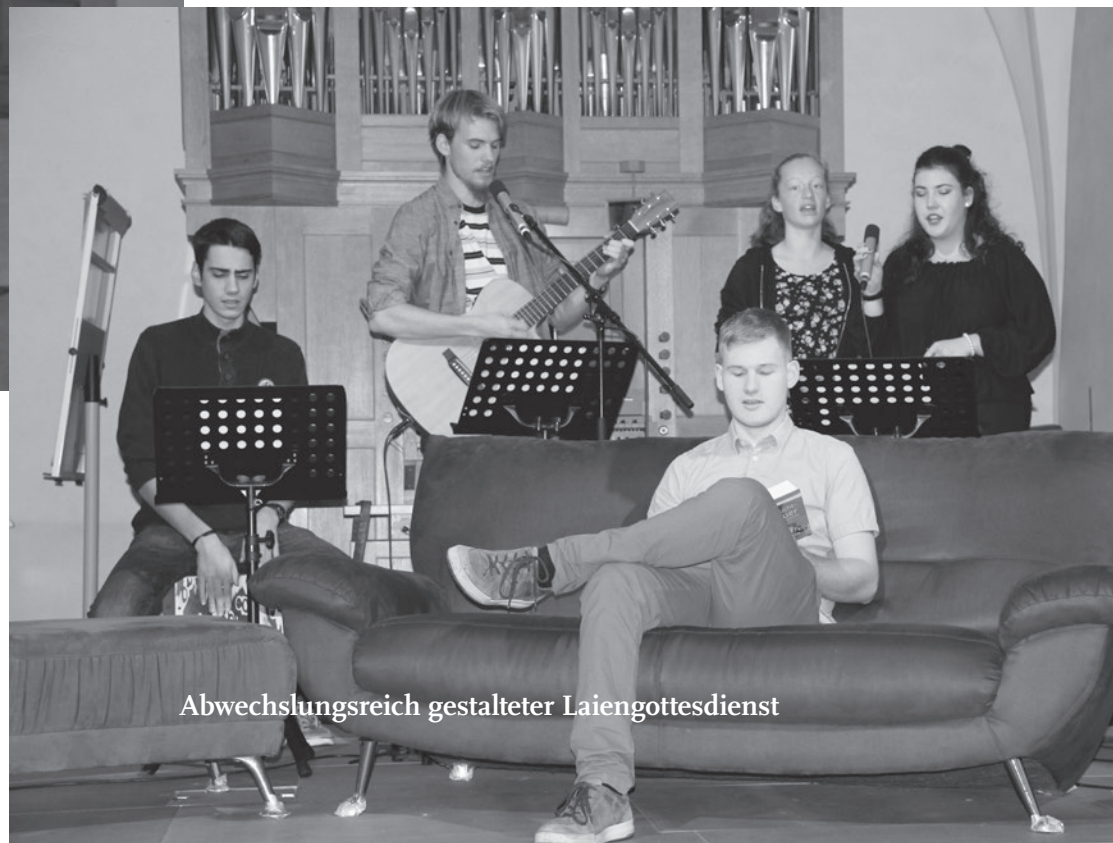
Abwechslungsreich gestalteter Laiengottesdienst