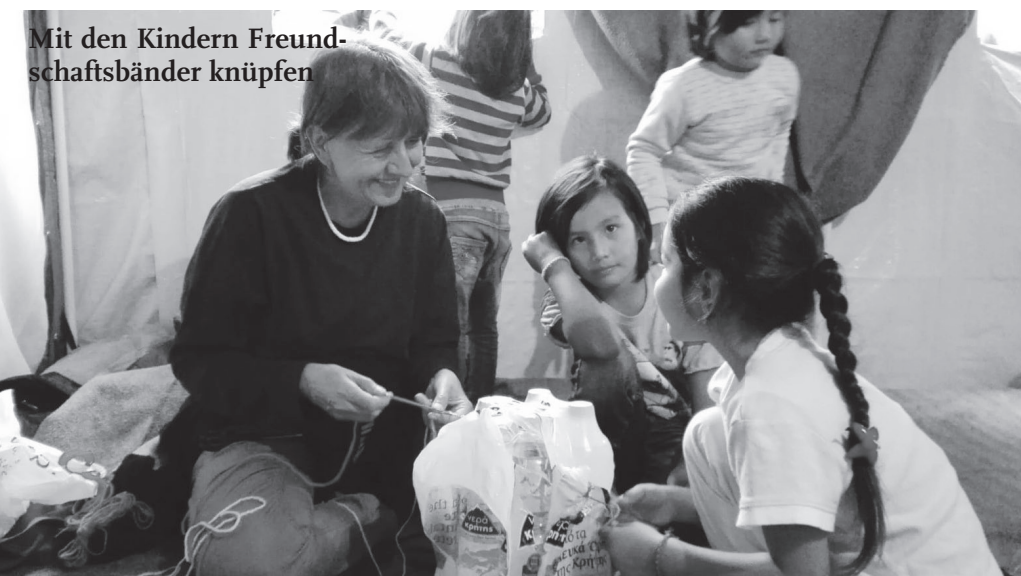
Mit den Kindern Freundschaftsbänder knüpfen