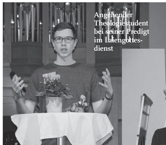
Angehender Theologiestudent bei seiner Predigt im Laiengottes- dienst