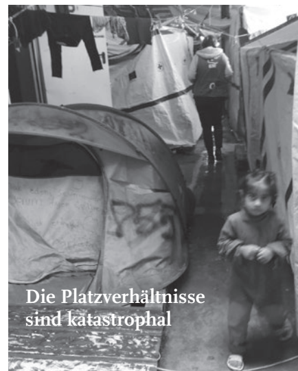
Die Platzverhältnisse sind katastrophal

Am nächsten Tag erlebe ich eine Überraschung: Wir sind zum Mittagessen bei einer pakistanischen Familie eingeladen. Als wir um halb drei zu ihrem Wohncontainer kommen, ist alles schon vorbereitet: Fleisch, Gemüse, Joghurt, frisches Fladenbrot - ein richtiges Festessen. Wieviel sie dafür wohl ausgegeben haben? Aber Gastfreundschaft geht über alles. Damit wir alle im Container Platz haben, wurde ein Bett hinausgestellt.