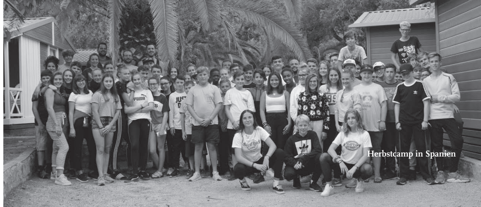
Herbstcamp in Spanien