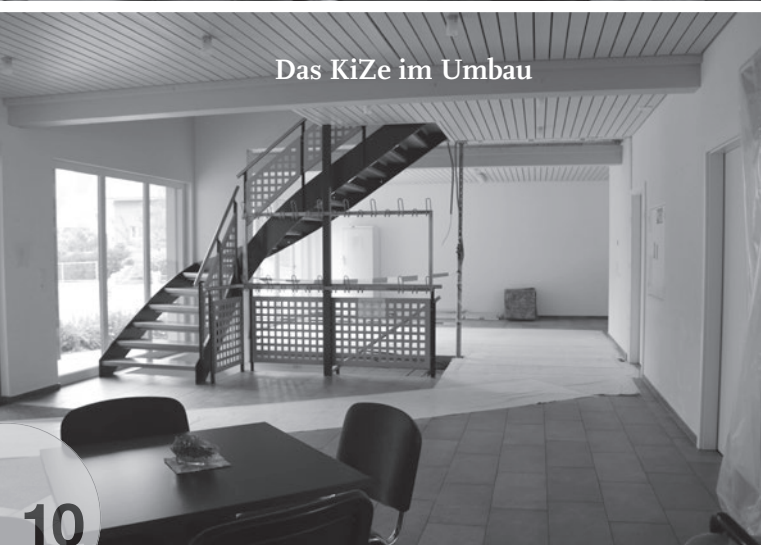
Das KiZe im Umbau