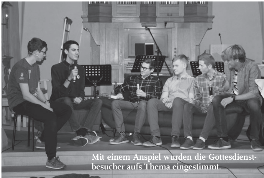
Mit einem Anspiel wurden die Gottesdienstbesucher aufs Thema eingestimmt.

Herzlichen Dank dem Vorbereitungsteam für diesen grandiosen Gottesdienst!