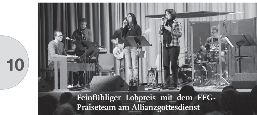
Feinfühlinger Lobpreis mit dem FEG-Praisetem am Allianzgottesdienst