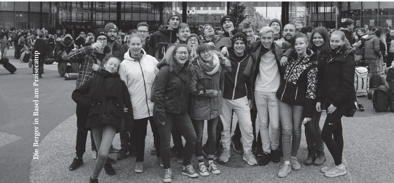
Die Berger in Basel am Praisecamp