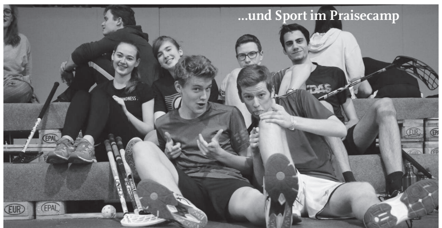
...und Sport im Praisecamp