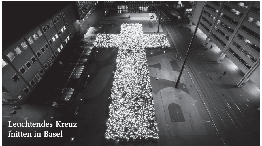
Leuchtendes Kreuz mitten in Basel

Das Thema am letzten Abend an Silvester war: «Führe uns nicht in Versuchung, sondern erlöse uns