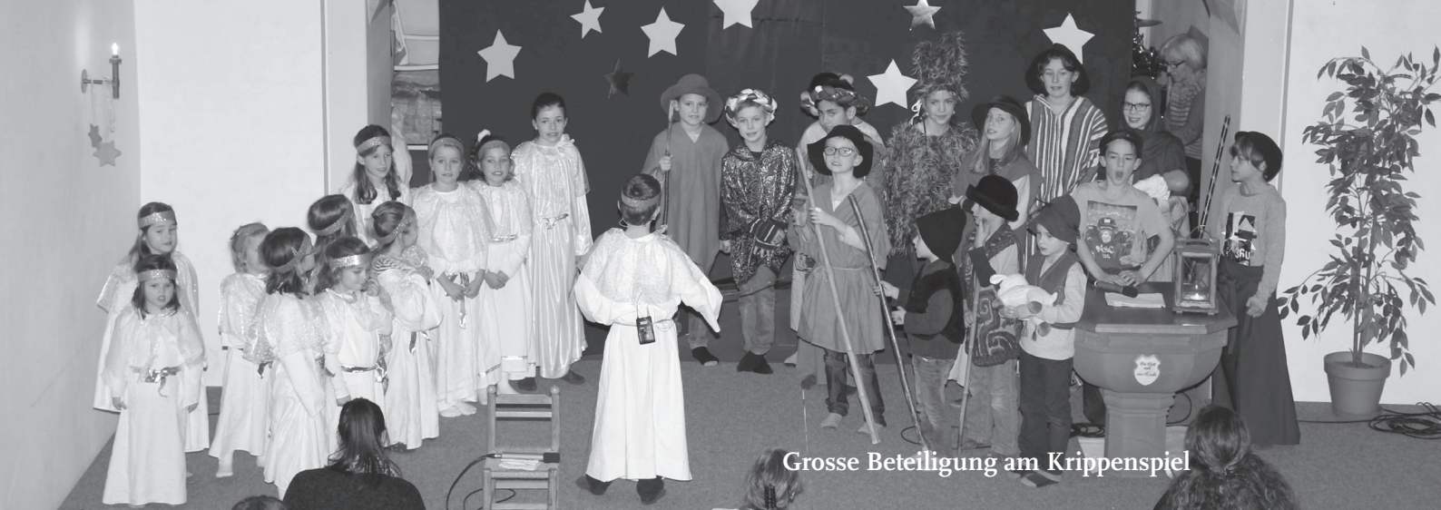
Grosse Beteiligung am Krippenspiel