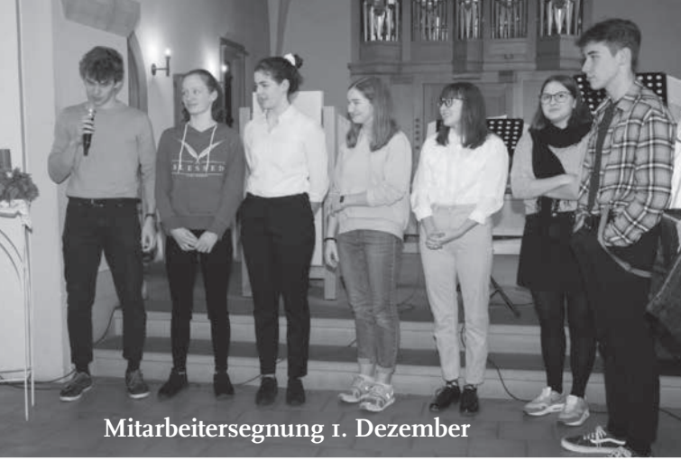
Mitarbeitersegnung 1. Dezember