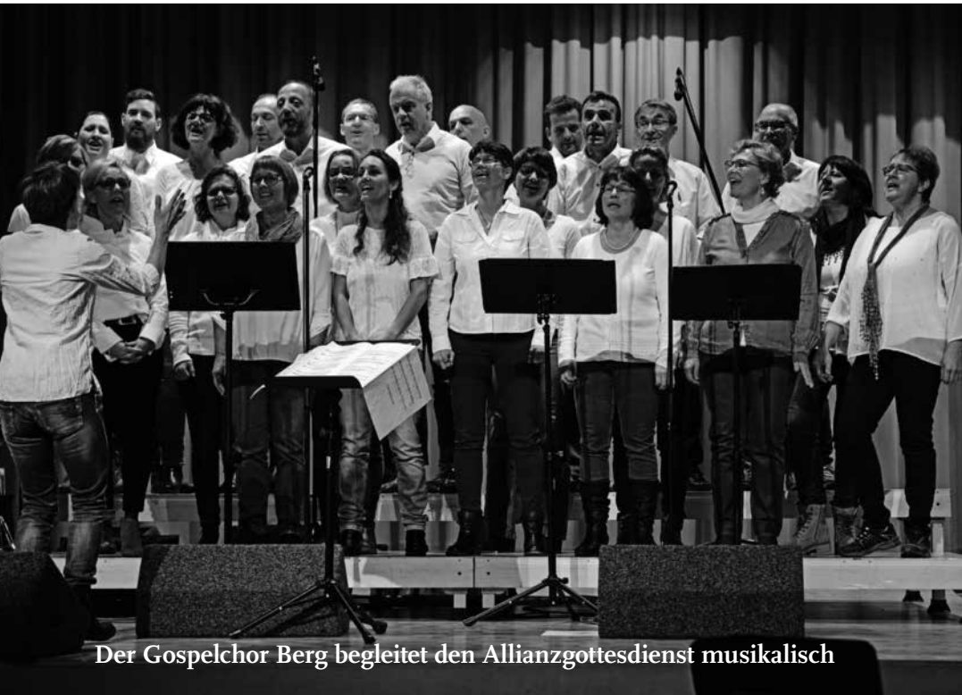
Der Gospelchor Berg begleitet den Allianzgottesdienst musikalisch