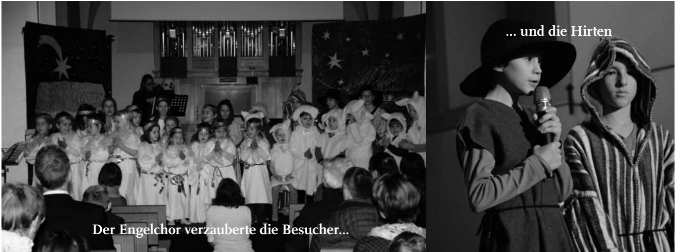
Der Engelchor verzauberte die Besucher...