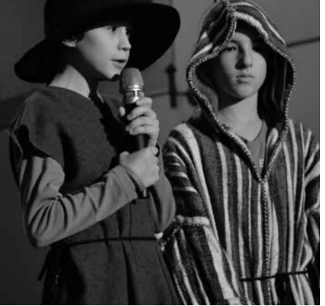
... und die Hirten