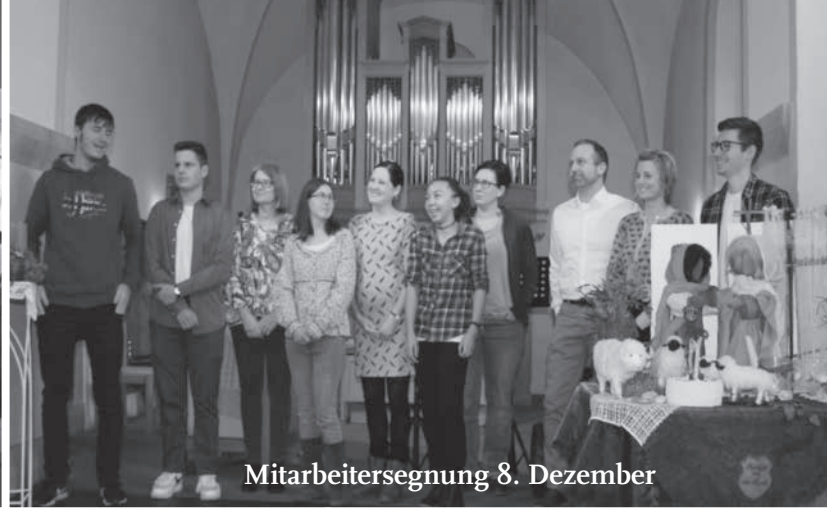
Mitarbeitersegnung 8. Dezember