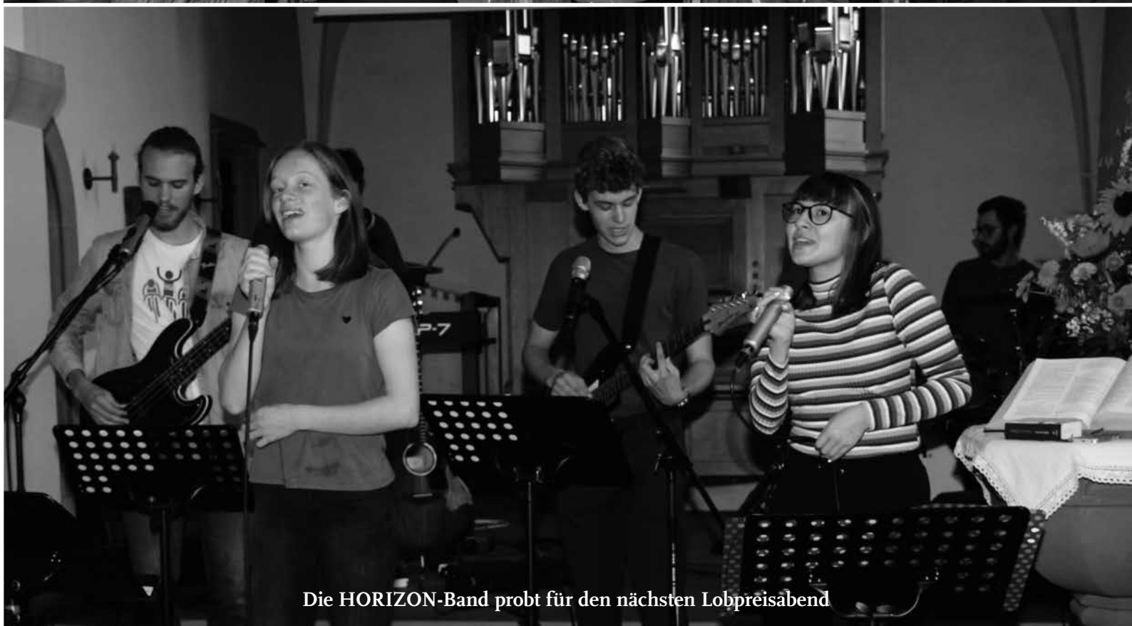
Die HORIZON-Band probt für den nächsten Lobpreisabend