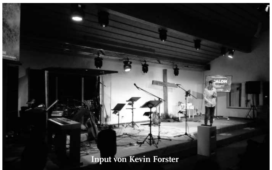
Input von Kevin Forster

Nach einer gemütlichen Zeit mit Hot-Dogs, Drinks und angeregten