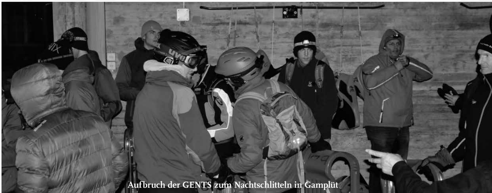
Aufbruch der GENTS zum Nachtschlitteln in Gamplüt