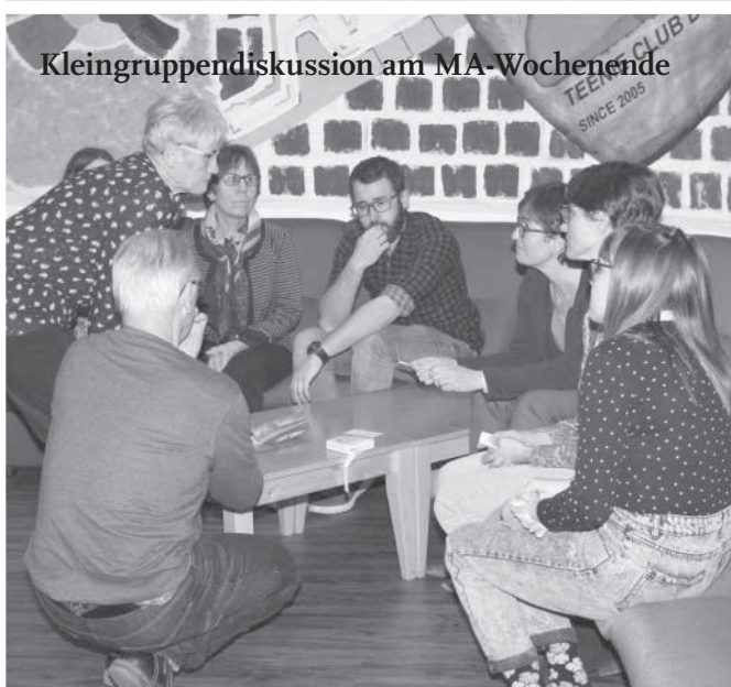
Kleingruppendiskussion am MA-Wochenende