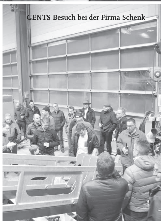
GENTS Besuch bei der Firma Schenk