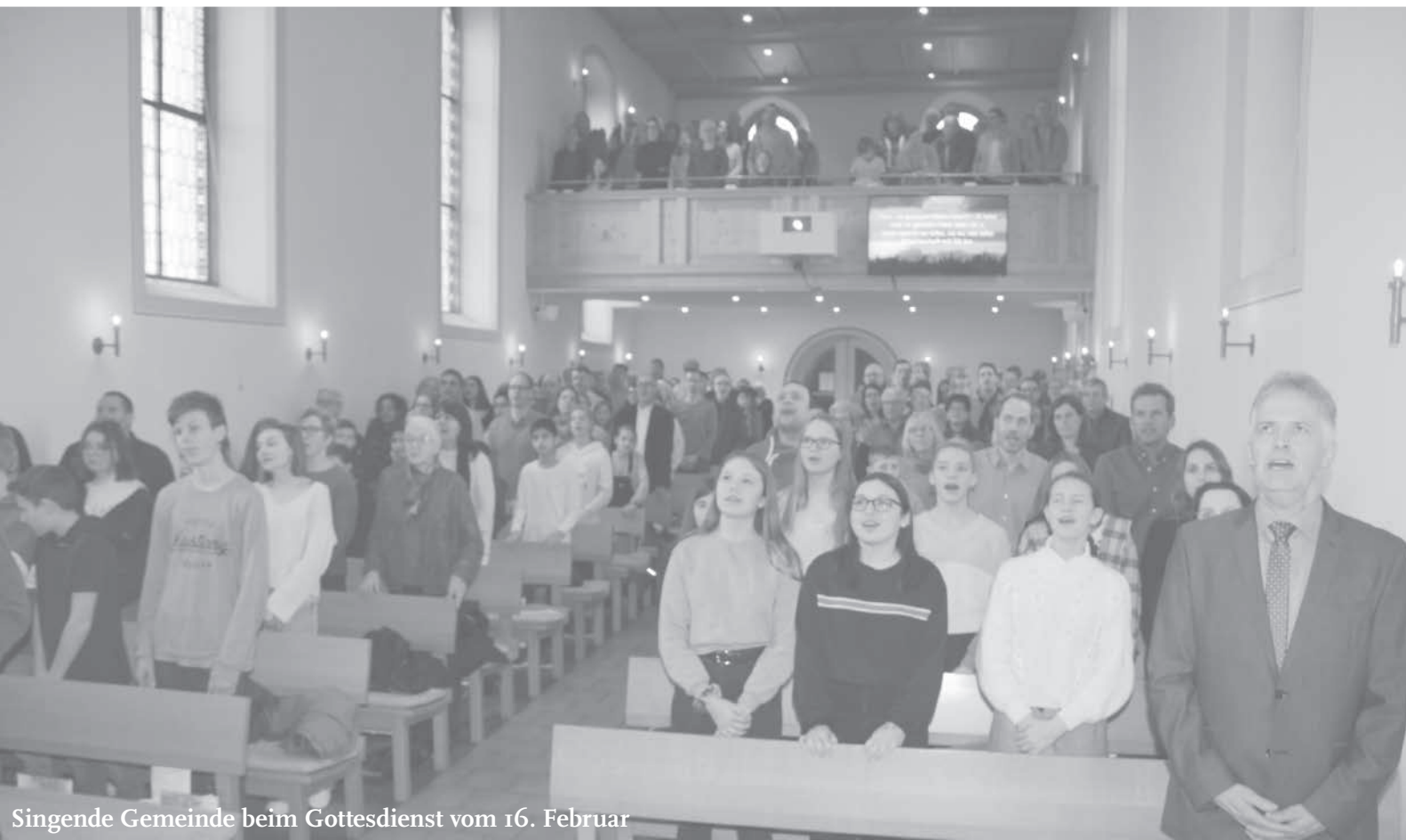
Singende Gemeinde beim Gottesdienst vom 16. Februar