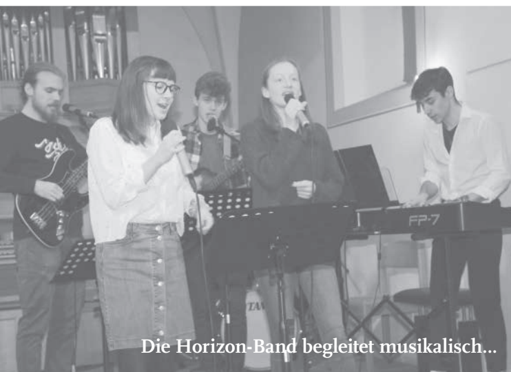
Die Horizon-Band begleitet musikalisch...