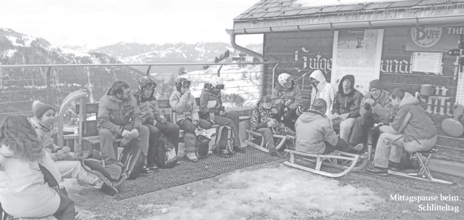
Mittagspause beim Schlitteltag