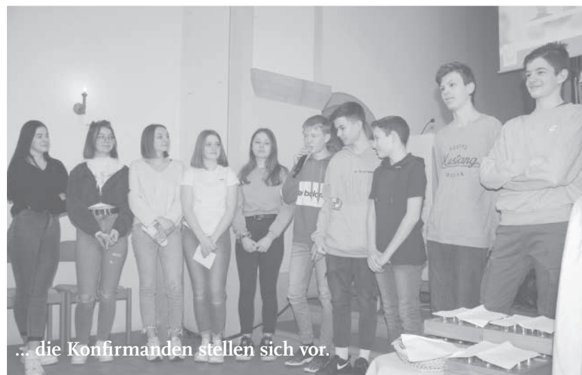
... die Konfirmanden stellen sich vor.