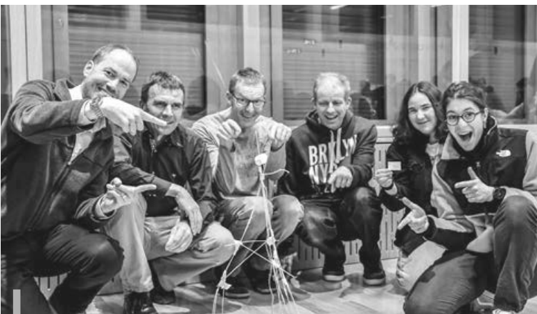
Teambuilding und Spielfreude pur

Mit dem Feiern des gemeinsamen Abendmahls am Sonntagnachmittag endete das Weekend und die Teilnehmer machten sich gestärkt auf den Heimweg.