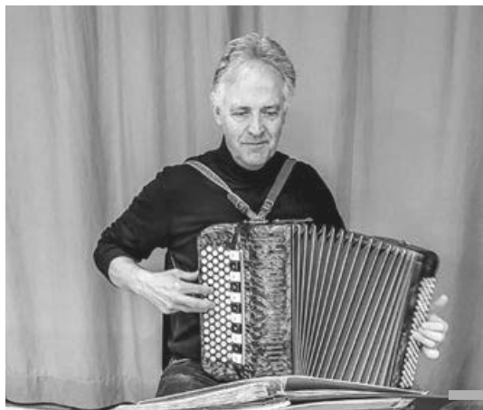
Unser Pfarrer einmal in anderer Rolle