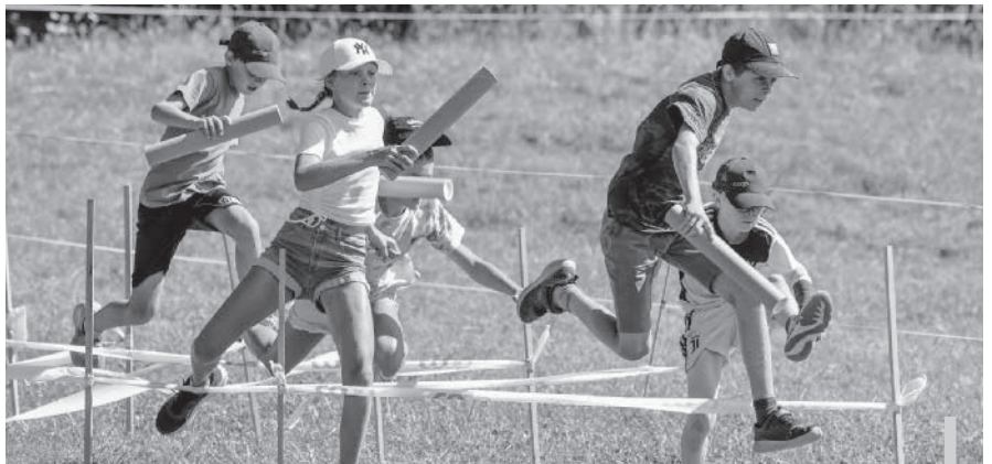
Auf der Weltreise im Sola bändigten Jungschar und TC in Peru Indiana Joni und am Abend wurden in gemütlicher Lagerfeuerstimmung Lieder gesungen.