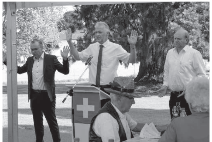
Bei der grossen 1. Augustfeier auf der Schlosswiese gestalteten die drei Berger Kirchen den Gottesdienst.