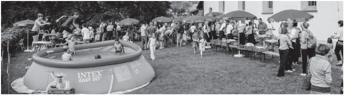
Am Kirchenfest stellten sich die neuen Konfirmanden und Konfirmandinnen im Gottesdienst vor. Danach gab es Zmittag vom Grill und viele Aktivitäten für Gross und Klein rund um die ganze Kirche.