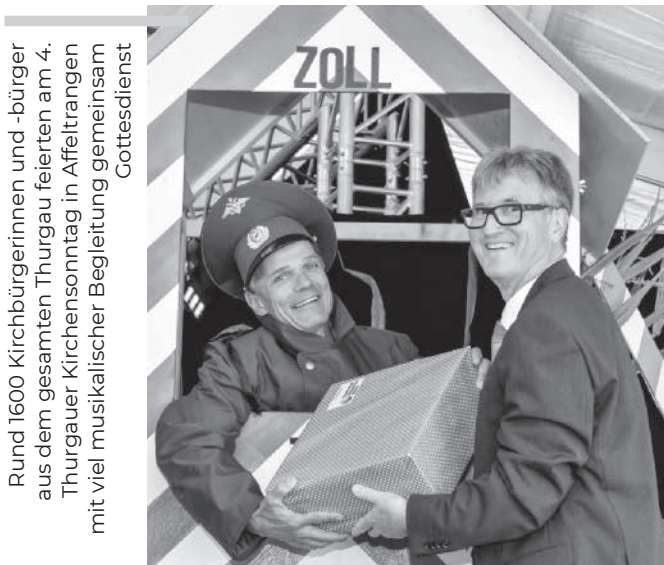
Rund 1600 Kirchbürgerinnen und -bürger aus dem gesamten Thurgau feierten am 4. Thurgauer Kirchensonntag in Affeltrangen mit viel musikalischer Begleitung gemeinsam Gottesdienst