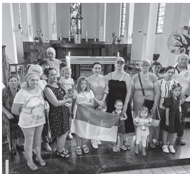
Ukrainergruppe am Friedensgebet in der Kath. Kirche.