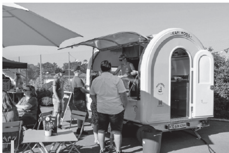
Kafi Mobil - Projekt der Landeskirche Thurgau

Zur grossen Vielfalt an übergemeindlichen Angeboten der Thurgauer Landeskirche gehören Kommissionen und Fachstellen für die kirchliche Jugendarbeit, für Diakonie, für Religionsunterricht, für die Erwachsenenbildung, die Information der Öffentlichkeit, für Mission und Entwicklungszusammenarbeit oder das Tecum, das kirchliche Zentrum für Spiritualität, Bildung und Gemeindebau in der Kartause uvm.