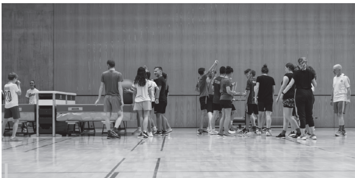
An der Limitless Sportsnight werden abenteuerliche wie auch altbekannte Turnhallenspiele gespielt.