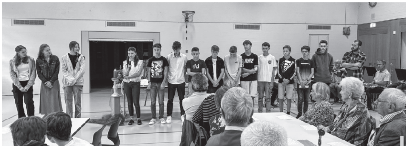
Am Dorfgottesdienst stellen sich die neuen Konfirmandinnen und Konfirmanden vor.