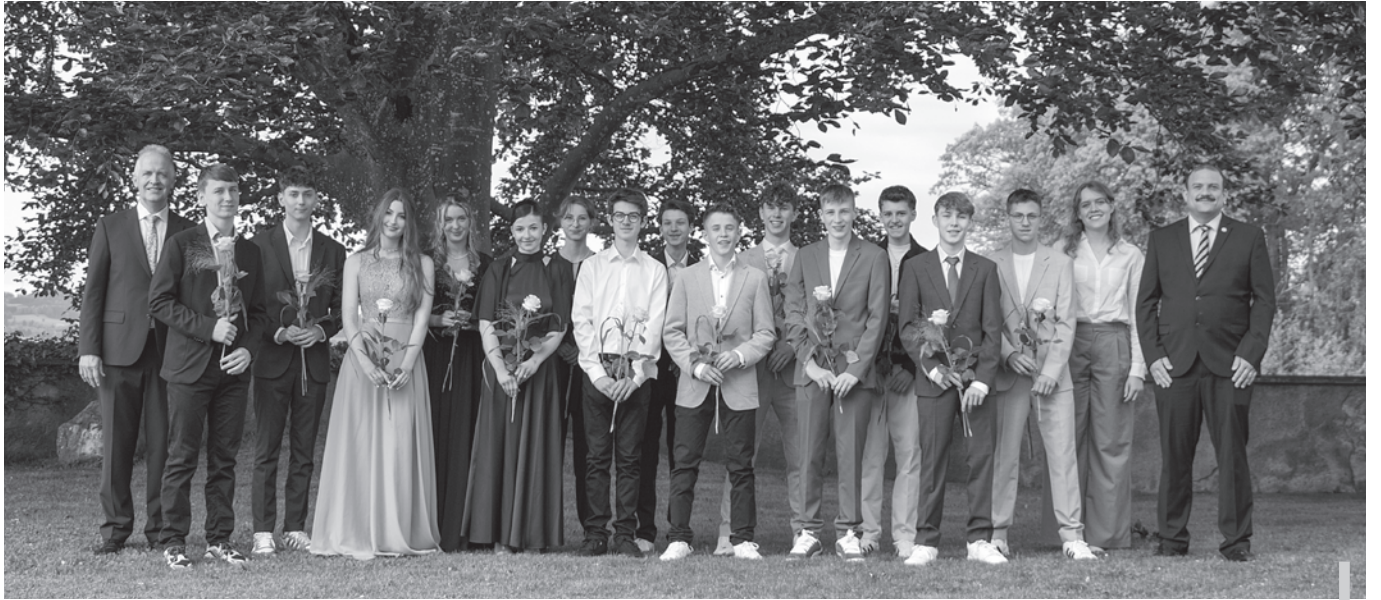
Unsere 14 Jugendlichen bei ihrer Konfirmation - ein herrlicher Festtag!