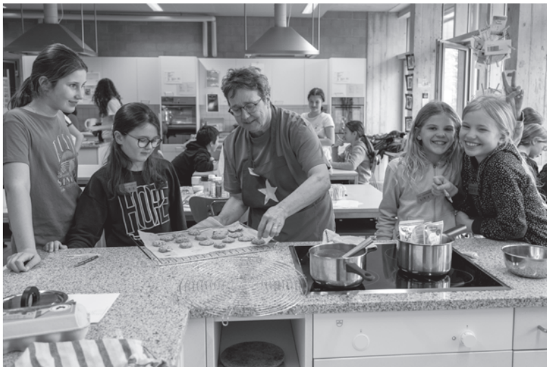
Im Pfila sind alle Jungschärler und TC-ler, Leiterinnen und Leiter, sowie alle Besucherinnen und Besucher voll im Element.