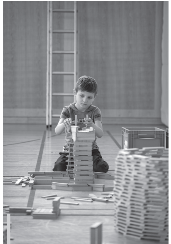
In der Kinderwoche wurden fleissig verschiedene Bauwerke mit der Holzbauwelt des Bibellesebundes gebaut. Daneben gab es auch andere Workshops, wie Backen, Tanzen, einen Besuch bei der Feuerwehr Berg oder Sport.