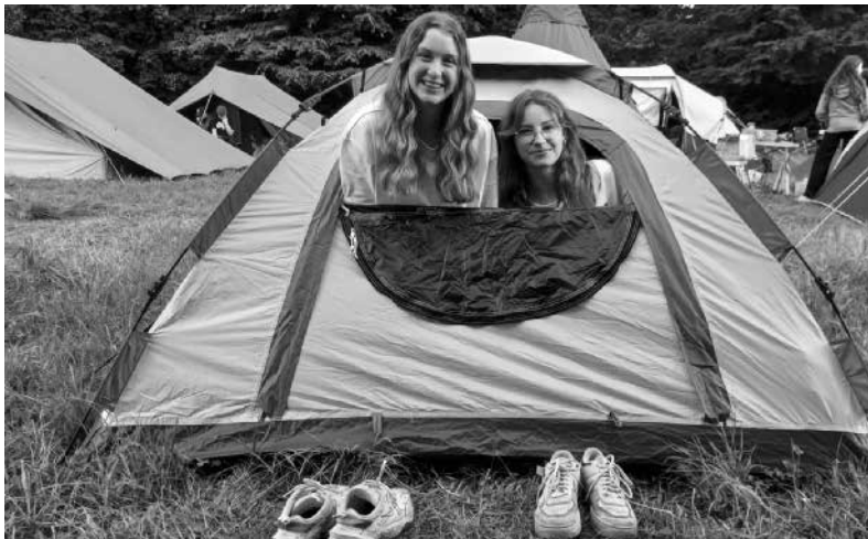
Sommerliche Festivalstimmung am Melo Festival.