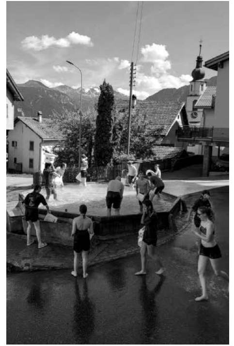
Konflager in Sarn GR.