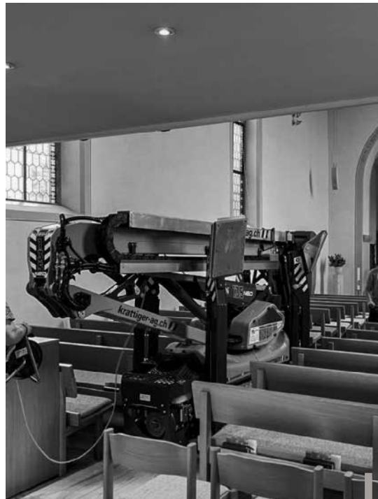
Mit dem Raupenkran wurden die defekten Strahler an der Kirchendecke ausgewechselt.