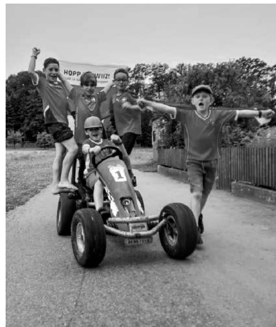
Am Ameisli-Weekend kühlten sich die Kinder am Nachmittag im Bach ab, am Abend wurde der Schweizer Sieg lautstark gefeiert.