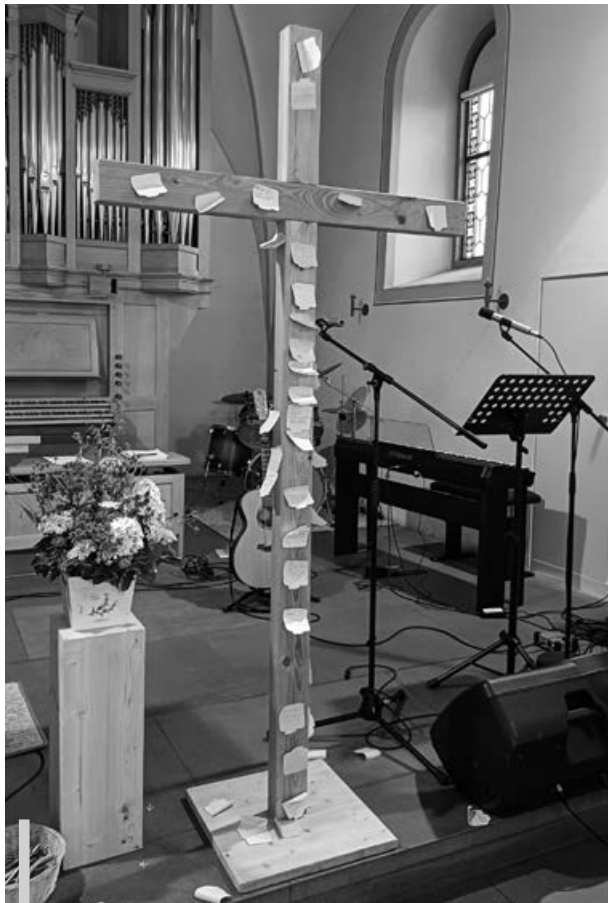
Kreuz voller Dank und Bitten von Kindern und Eltern beim Schulanfangsgottesdienst, kurz vor dem Start ins neue Schuljahr.