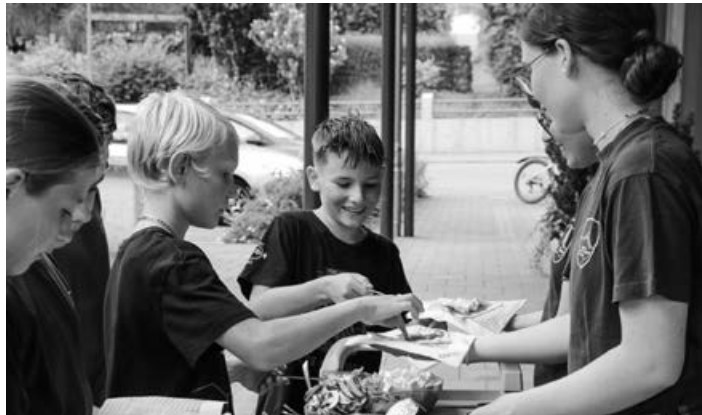
Beim Ameisli- und Jungschar-Schnuppernachmittag gibt es Pizza aus dem selbstgebauten Dosen-Ofen.