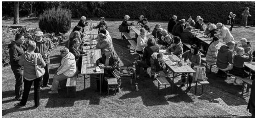
Ökumenischer Betttagsgottesdienst mit der Musikgesellschaft Berg und anschließender Begegnung vor der Kath. Kirche.

Ausflug zur sozialen Integration: Mit ukrainischen Schutzsuchenden von der Tellsplatte über den Gotthardpass bis nach Versam und zurück nach Berg.