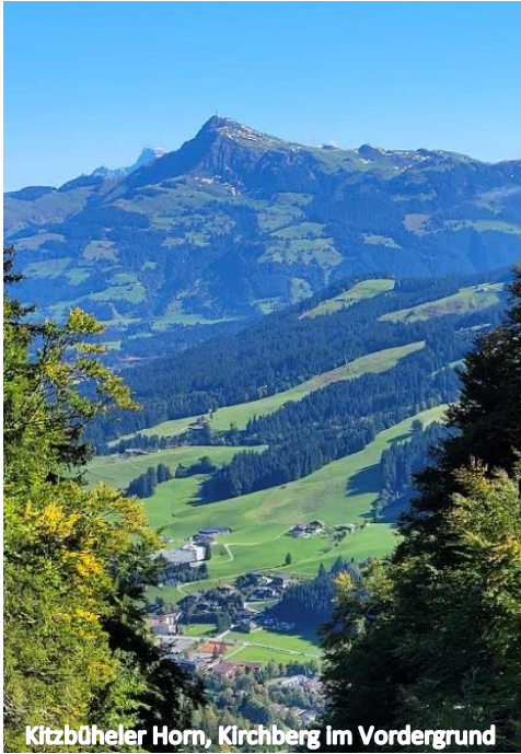
Kitzbüheler Horn, Kirchberg im Vordergrund

Das Bild des Reisens ist auch ein Bild für das Leben. Unser Leben ist eine Reise – von der Wiege zur Bahre, aus der Ewigkeit hin zur Ewigkeit, eine Reise mit vielen verschiedenen Wegen und Stationen, ein Entdecken, Lernen, Wachsen, Gehen und Ankommen.