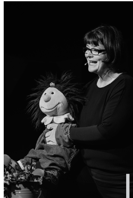
Die Adonia KidsParty füllte die MZH für einen Nachmittag mit viel Musik, unterschiedlichsten Spielen und Brigä & Adonette berichteten über die Geschichte des verlorenen Sohnes.