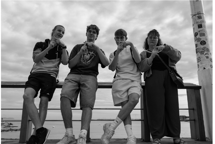
Jugendliche aus Berg, Weinfeldern und Felben verbrachten im Herbstcamp 10 Tage in Spanien an der Costa Brava.