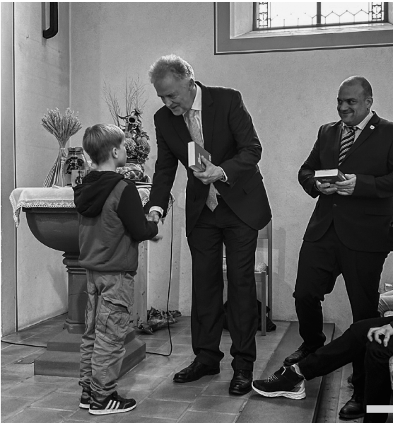
Feierliche Bibelübergabe an die 3. Klässlerinnen und 3. Klässler während dem Erntedankgottesdienst.