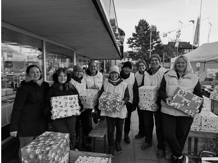
An der Päckliaktion sammelten die drei Kirchgemeinden in Berg dank unzähligen Spendenden und Helfenden 552 Päckli, die anschließend an die Sammelstelle in Frauenfeld übergeben wurden.