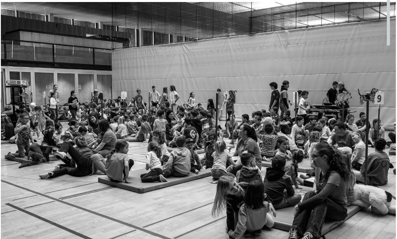
Mehr als 200 Kinder besuchen im April die Kinderwoche in der MZH.