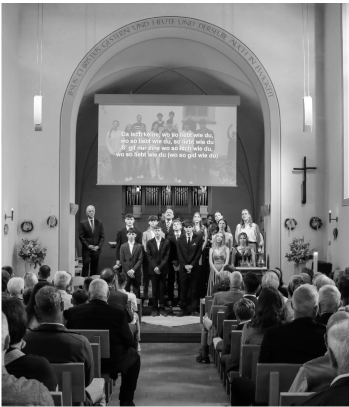
An zwei Konfirmationen feiern 20 Jugendliche mündige Kirchenmitgliedschaft.