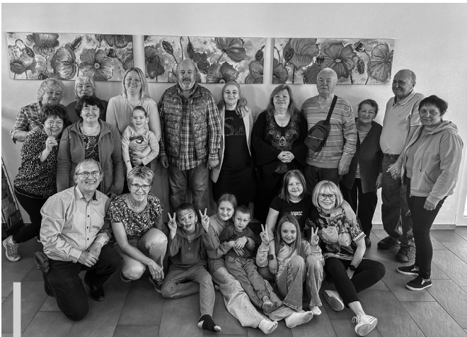
Zahlreiche unserer ukrainischen Freunde folgen einer Einladung zum Osterbrunch.