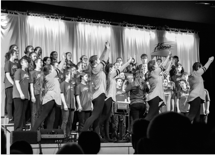
Knapp 70 Jugendliche präsentieren im Adonia Musical die Geschichte des Propheten Jona auf bewegende Weise.