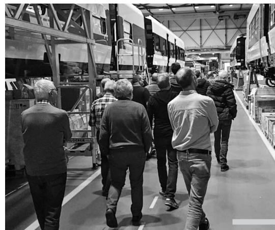
Die GENTS Männergruppe besucht im März die Stadler Rail und bummelt im Mai auf den Nollen.