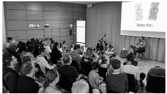
Die erste Durchführung der Kirche Kunterbunt war ein voller Erfolg – mit viel Kreativität, Gemeinschaft und kunterbunten Aktivitäten für Gross und Klein.