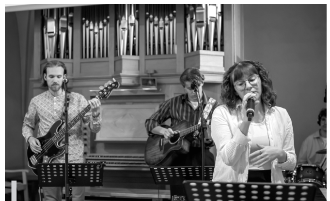
Die Horizon Band begleitet die Konfirmationen musikalisch.