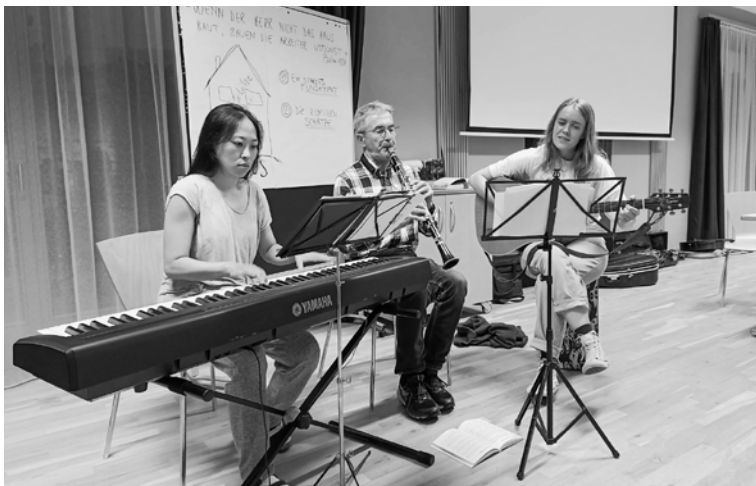
... Musik und Spielen für Gross und Klein.