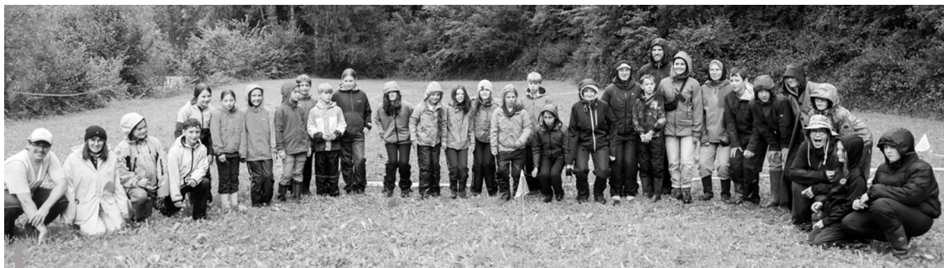
Jungschar und TC reisten im Sommerlager gemeinsam durch die Zeit – von Eden bis in die 80er.