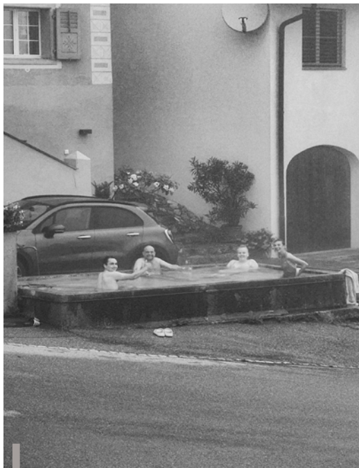
Leiterfrühschwimmen um 06.00 Uhr