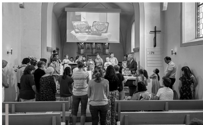
Familiengottesdienst mit Abendmahl und den 5. Klässlern.