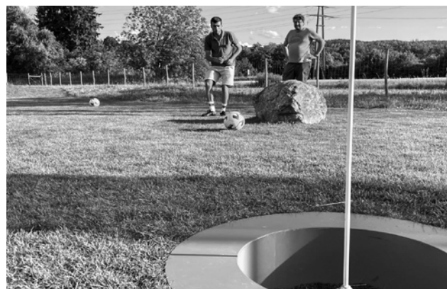
Die GENTS Männergruppe genießt einen Sommerabend beim Fussballgolf in Müllheim.