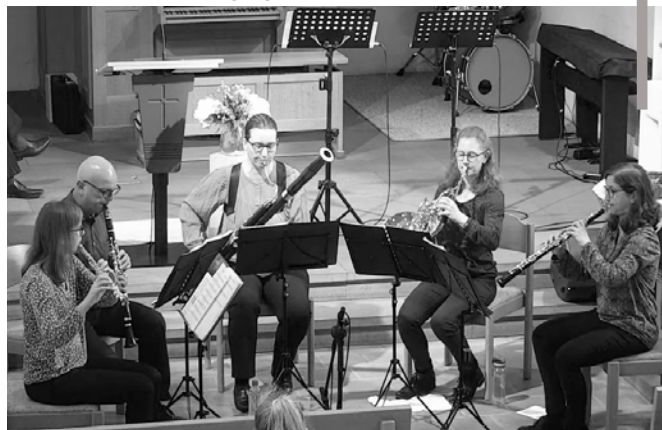
Das Bläserquintett Weiss bereichert den Pfingstgottesdienst mit festlicher Musik.