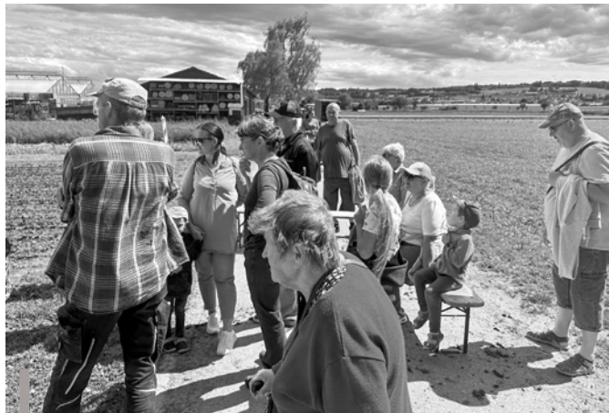
Ausflug mit unseren ukrainischen Freunden im Rahmen des Freitags-Kafis: Besuch bei einem Gemüsebauer in Tägerwilen – mit spannenden Einblicken in die regionale Landwirtschaft.