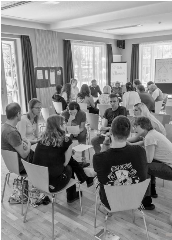
Fröhliche Gemeindeferien in Kempten – Mit Gesprächen ...