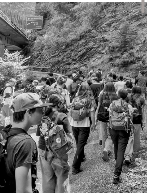
Wanderung in der Viamalaslucht