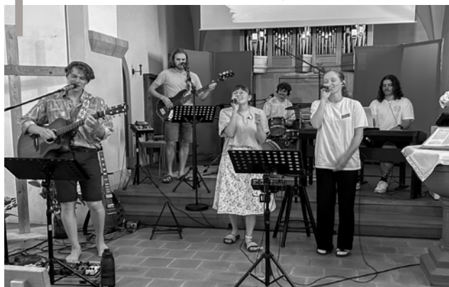
Die Horizon-Band gestaltet einen Lobpreisabend. Der nächste Horizon findet am 28. September statt.