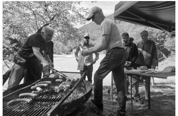
Die GENTS-Männergruppe beim River-Rafting in der Rheinschlucht – Gemeinschaft und Adrenalin, gefolgt von gemütlichem Grillen am Feuer.