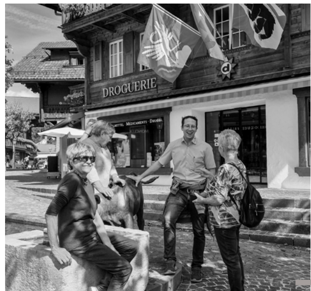
Weitere Bilder der Ferienwoche auf der Bilder-Doppelseite S. 10/11.