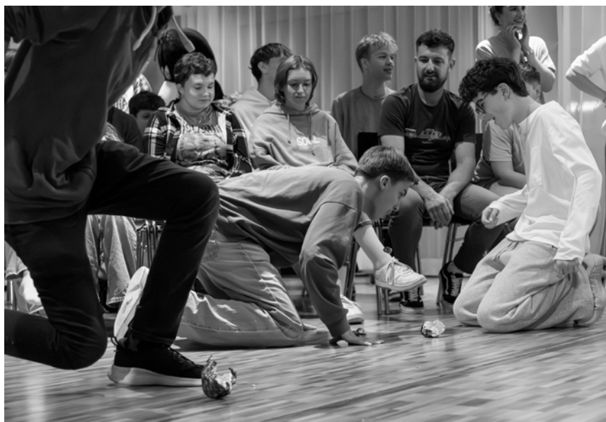
20 Jahre Teenie Club – ein Party voller Spiele und Erinnerungen, wie man es nur im TC erlebt.