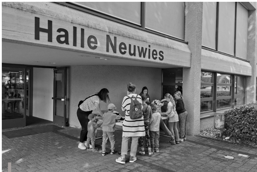
In der Kirche Kunterbunt erlebten Gross und Klein die Schöpfungsgeschichte an verschiedenen Aktivposten.