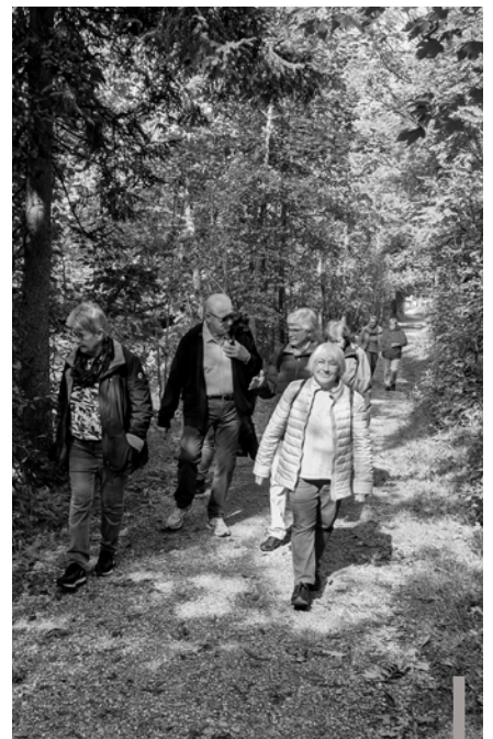
Unterwegs mit der Ferienwoche 60plus.