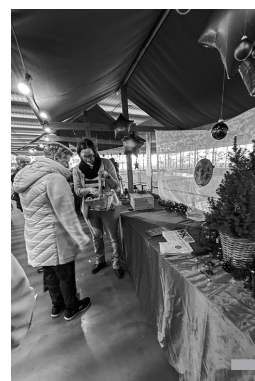
Der Stand der Evang. Kirchgemeinde Berg in der MZH sorgt am Weihnachtsmarkt für zahlreiche Begegnungen.