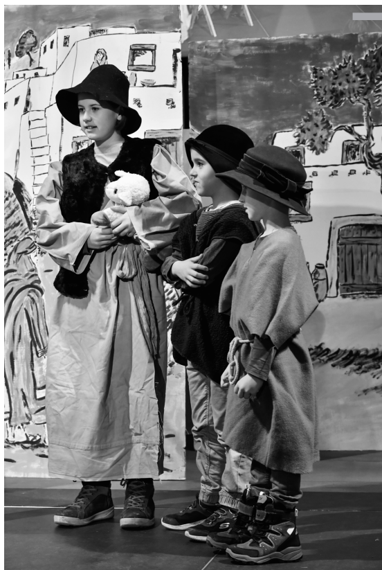
Die Kinder des Kindstreifs lassen die Weihnachtsgeschichte mit ihrem Weihnachtsspiel lebendig werden.