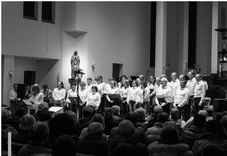
Der Gospelchor stimmt am Konzertabend in der katholischen Kirche mit stimmungsvollen Liedern in die Adventszeit ein.