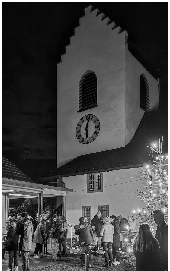
Vor der Kirche lädt der Ffir-Obig mit einem Adventfenster zum Verweilen ein.