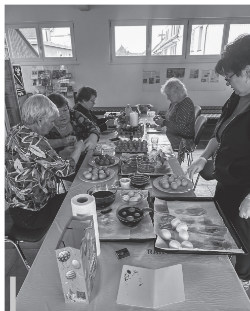
Vor Ostern färben ukrainische Frauen gemeinsam Eier im KiZe.