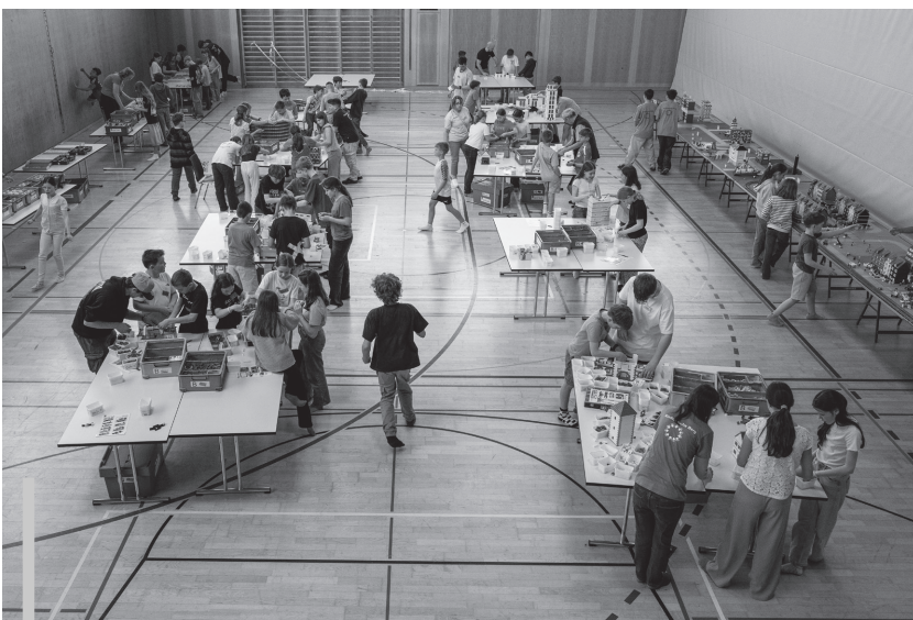
Mit viel Begeisterung entsteht während der Kinderwoche eine beeindruckende LEGO®-Stadt.