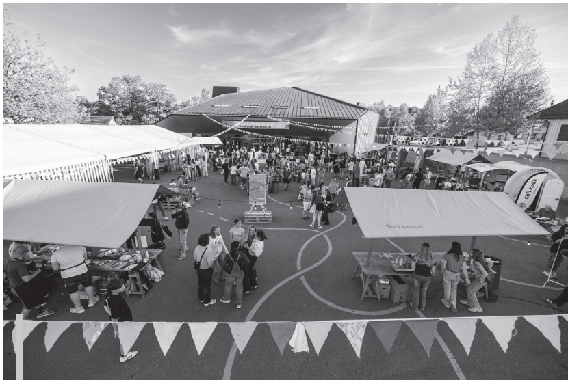
Schon vor Türöffnung herrscht auf dem Vorplatz des Pentorama eine gemütliche Atmosphäre: Essensstände, Musik von regionalen Bands und viele Begegnungen prägen die Godi Conference.