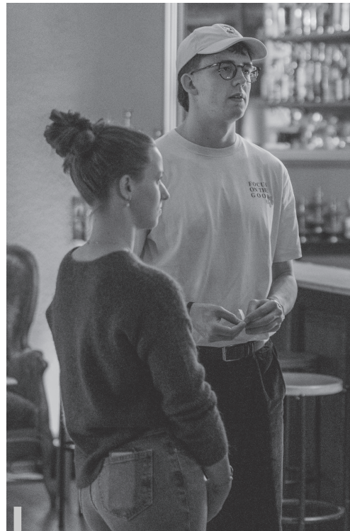
Kirche mal anders: Beim «Get together» treffen sich junge Erwachsene aus dem ganzen Thurgau zu offenen Gesprächen.